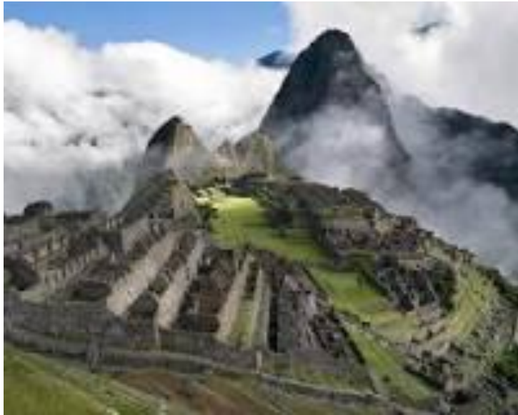
UNESCO- Weltkulturerbe Machu Picchu (Peru)