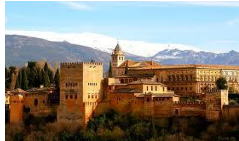
La Alhambra (Spanien)